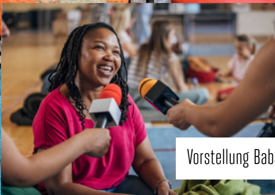
Vorstellung Baba news / Présentation Baba news

Gemeinsam für Gewaltfreiheit und Versöhnung