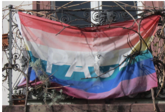
Friedensfahne beim IFOR-MIR Sekretariat in Riehen Drapeau de la paix au secrétariat IFOR-MIR à Riehen

Falls Sie Interesse haben, an der Jahresversammlung zu dolmetschen (von Französisch auf Deutsch oder von Deutsch auf Französisch) melden Sie sich bitte bei uns. Vielen Dank. Secretariat@ifor-mir.ch Mehr Informationen erhalten Sie rechtzeitig per Post und über unserer Website. Der Vorstand