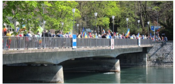
18.04. 2022 Ostermarsch Bern

Wir bekamen Anfragen von Menschen, die sich ohnmächtig fühlten und nach Antworten suchten, wie sie selbst helfen können. Andere wiederum teilten uns mit, wie sie sich für den Frieden und die Flüchtlinge einsetzten. Online beteiligten wir uns an Diskussionen und schrieben Kommentare zu Artikeln zum Thema Ukraine Konflikt. Die Reaktionen auf unsere Vorschläge von gewaltfreien Lösungsansätzen und Hinweise auf alternative Friedensexpertenmeinungen waren sehr verschieden. Die Aussage "Jetzt habe ich endlich jemanden gefunden, der genauso denkt wie ich, vielen Dank" war genauso dabei wie persönliche Beleidigungen.