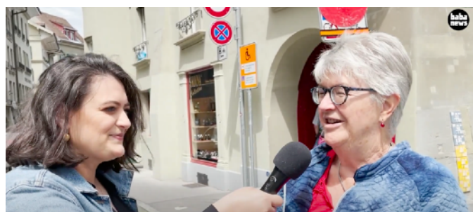
Hätten Sie den Einbürgerungstest bestanden? - Baba news Reporterin befragt Leute auf der Strasse Auriez-vous réussi le test de naturalisation ? - La journaliste de baba news interroge les gens dans la rue

Eigentlich immer, wenn uns Leute in einem Video das Vertrauen entgegenbringen, indem sie auch schwierige oder persönliche Themen ansprechen. So haben wir zum internationalen Tag gegen Gewalt an Frauen ein Video veröffentlicht, welches mit dem Patriarchat in der albanischen Community abrechnet. Darüber offen zu sprechen ist schwierig, weil Kritik an den eigenen Herkunftscommunitys von rechten Kräften für Hetze instrumentalisiert werden kann. Dass wir es schaffen, solche Themen aufzunehmen, indem Leute zu uns kommen und darüber sprechend, ist sehr berührend.