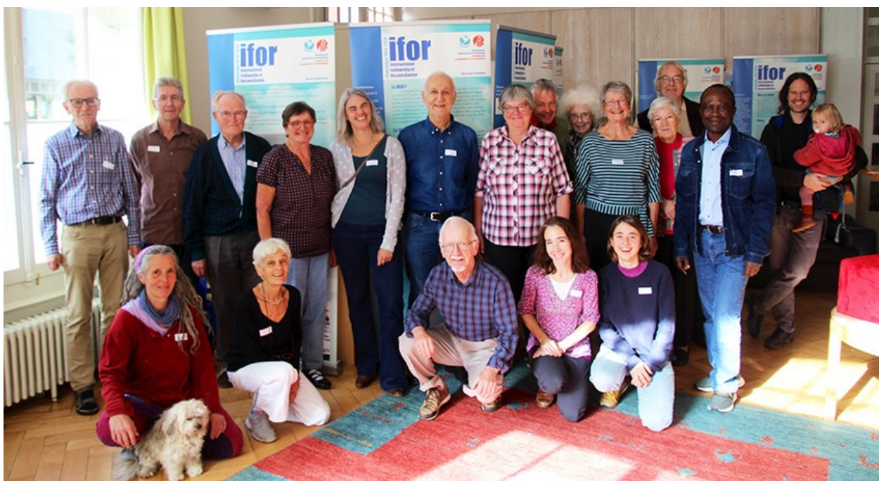
29.10. 2022 Zürich: Jahresversammlung IFOR-MIR Schweiz 29.10. 2022 Zurich : Assemblée annuelle IFOR-MIR Suisse