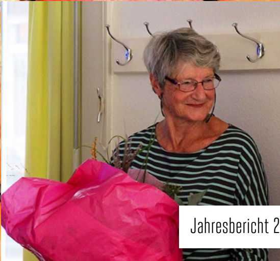
Jahresbericht 2022 / Rapport annuel 2022