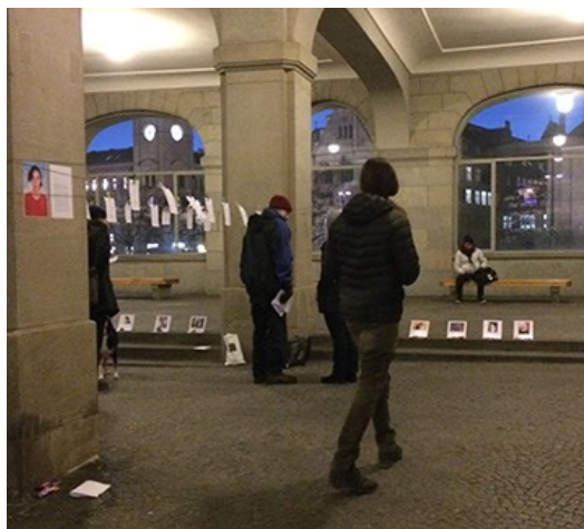
Ausstellung am Tag der Menschenrechte in Zürich Exposition journée des droits de l'homme à Zurich

Suisse, nous participons au groupe préparatoire.