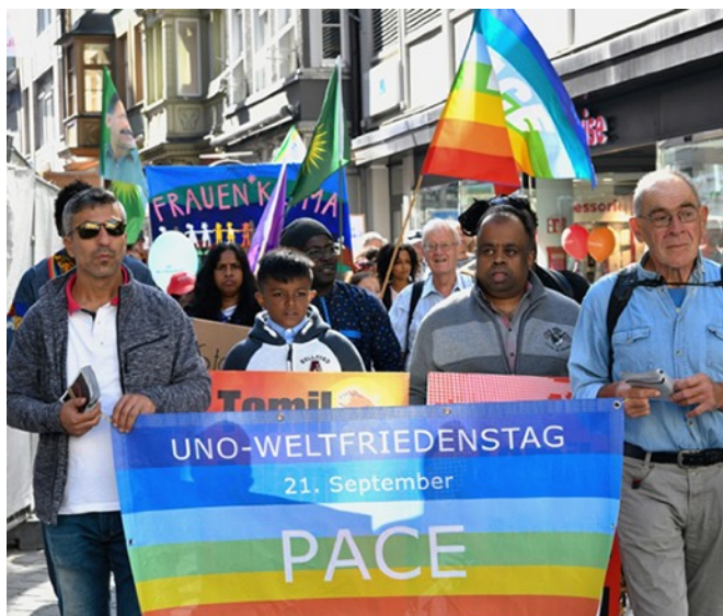
Weltfriedenstag 21. September in St. Gallen Journée mondiale de la paix 21 septembre à Saint-Gall