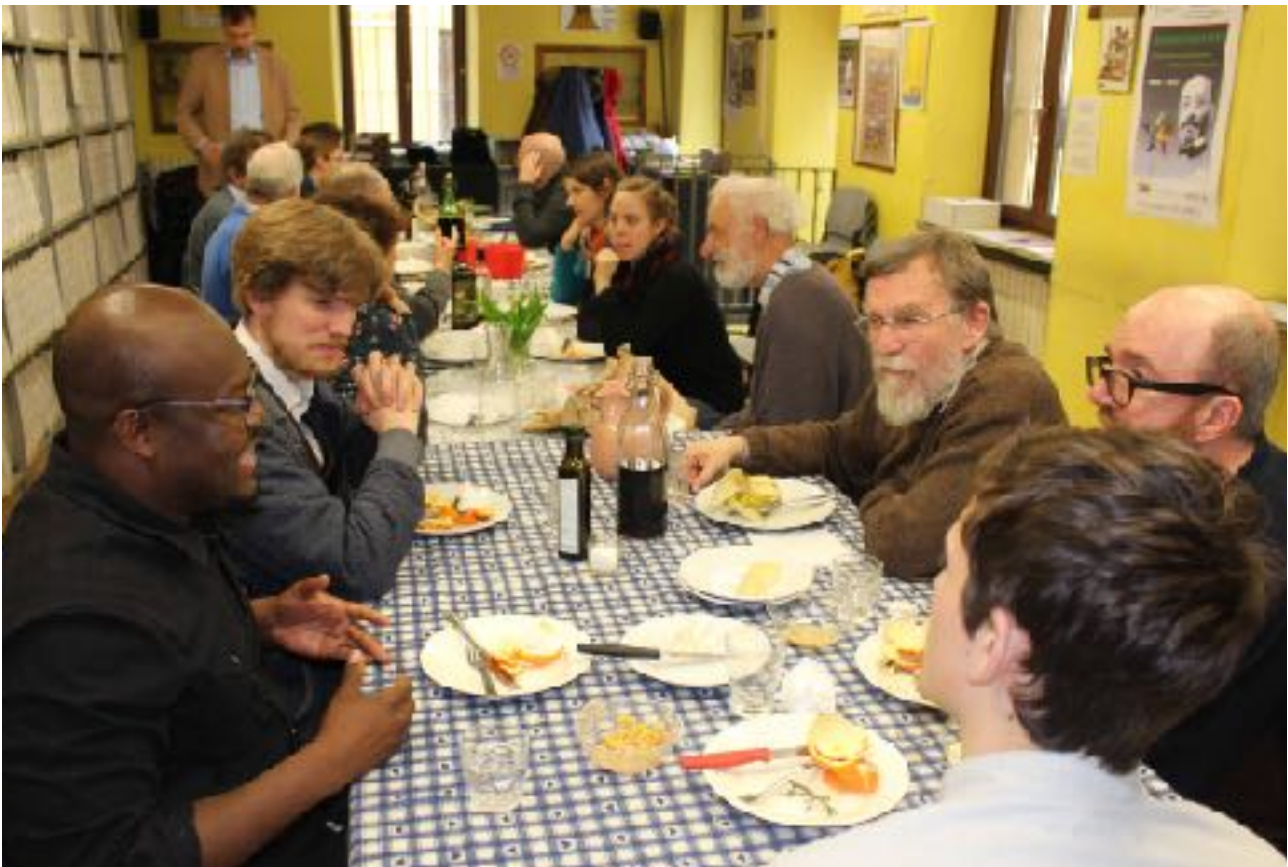
Zusammen essen ist wichtig und schön - EUFOR 2018 - Manger ensemble, c'est beau et important