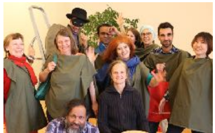
Interkulturelles Theater Thespis