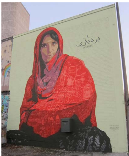
Wandgemälde an der Uferstrasse in Basel Peinture murale au long de la Uferstrasse à Bâle

Cette année, le groupe One Planet s'est concentré sur le thème de l'agriculture. L'initiative sur l'eau potable et celle sur les pesticides, qui ont été soumises au vote en juin, nous ont donné l'impulsion nécessaire. Comme ces deux initiatives avaient pour objectif une agriculture durable, elles correspondaient bien à la mission de notre groupe One Planet.