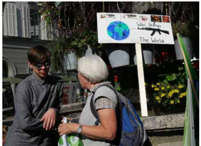
Journée internationale de la paix le 23.9. à St. Gall