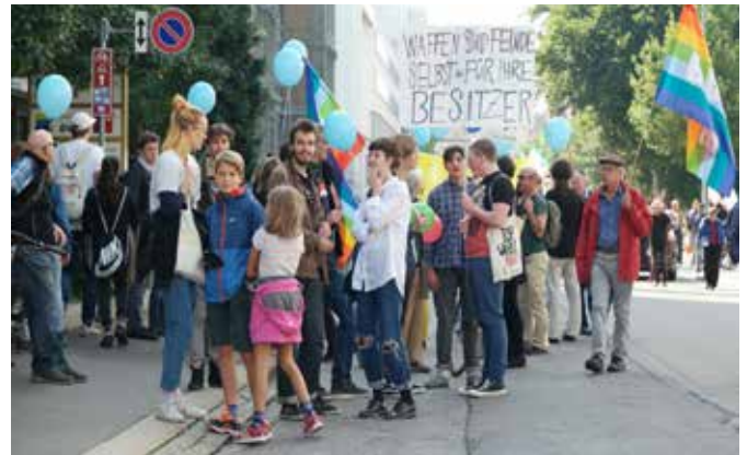
Manifestation lors de la journée internationale de la paix «Entwaffnen» le 23. September à St. Gall