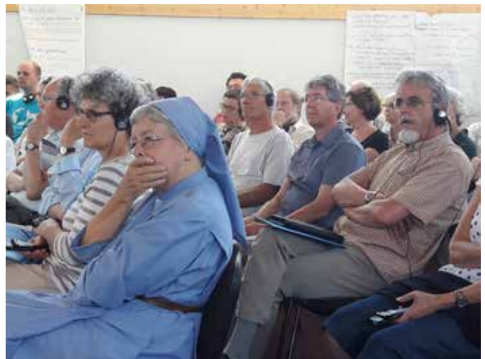
Lors de la conférence Eglise & Paix à Strasbourg 2017

A Strasbourg avec les délégués européens d'Eglise et Paix, du 9 au 11 juin 2017. Rapport sur ifor-mir.ch. Deux pages sont consacrées au communiqué de cette réunion dans le dernier numéro de Nonviolenz-MIROir (2/2017).