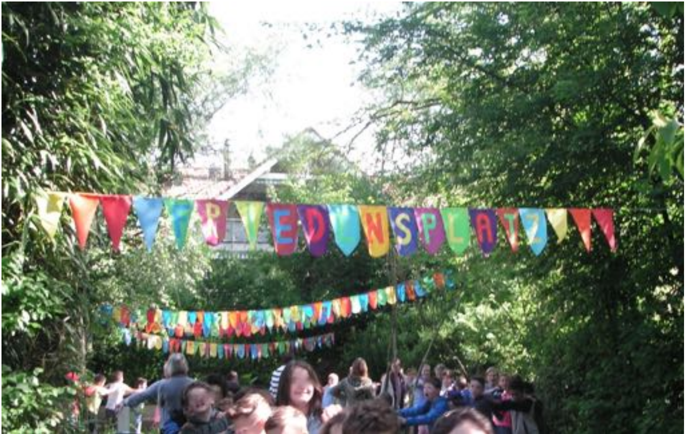
Projekt Friedensplatz / Projet Place pour la paix

Besprechung in Olten. Schon bald hatten wir uns entschieden, die Eröffnung der Friedensstationen in der Ostschweiz zum Anlass zu nehmen, erneut eine friedenspädagogische Tagung zu organisieren. Die Gruppe steckt seit November in den Vorbereitungen.