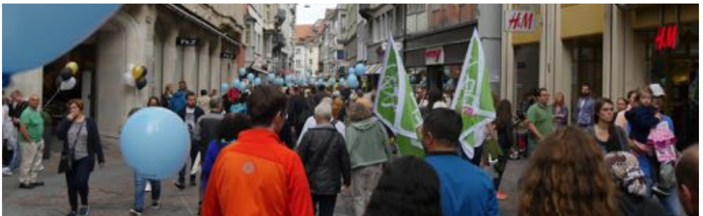
Ostermarsch in Konstanz / Marche de pâques à Constance