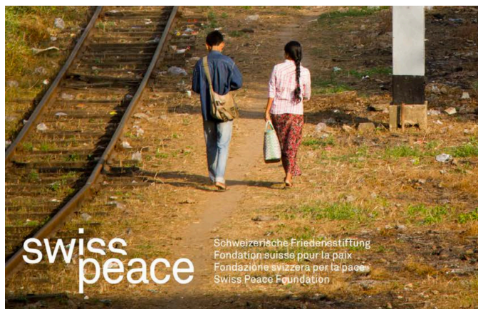
Couverture du rapport / Jahresbericht 2016 / www.koff.swisspeace.ch

Compte postal: 80-26941-6 / IBAN:CH18 0900 0000 8002 6941 6