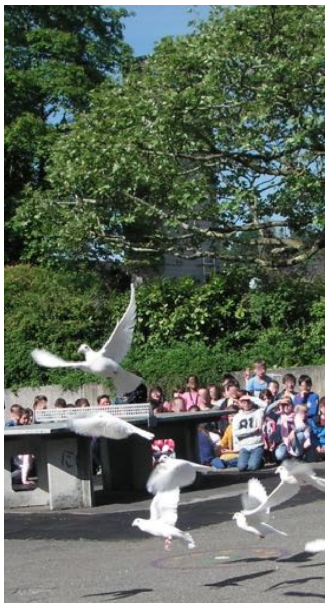
Projekt Friedensplatz / Projet Place pour la paix

Weiterhin arbeitet IFOR MIR im Netzwerk Friedenserziehung Schweiz mit. Die Kerngruppe des Netzwerks traf sich 2016 drei Mal: am 28.4., 23.6. und am 15.11. zu einer jeweils 2-stündigen